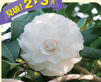
ポップ・ジョン23世