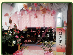
※写真は昨年度のものです