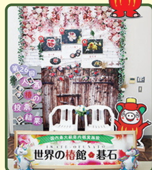
※写真は昨年度のものです