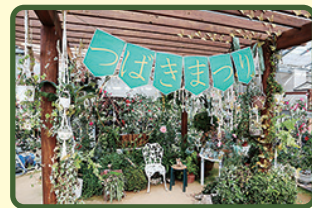
※写真は昨年度のものです