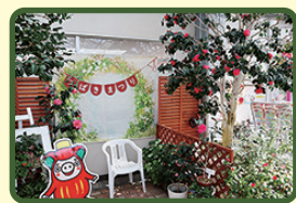
※写真は昨年度のものです